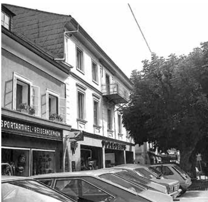
Der dicht verparkte Schladminger Hauptplatz und reger Durchzugsverkehr. Erinnerungen, die noch gar nicht so lange zurückliegen.

Aufschlussreiche Einzelheiten zum Thema finden sich auch in Heribert Thallers Fotodokumentation Schladming im Wandel der Zeit . Band 1. Schladming 2011.