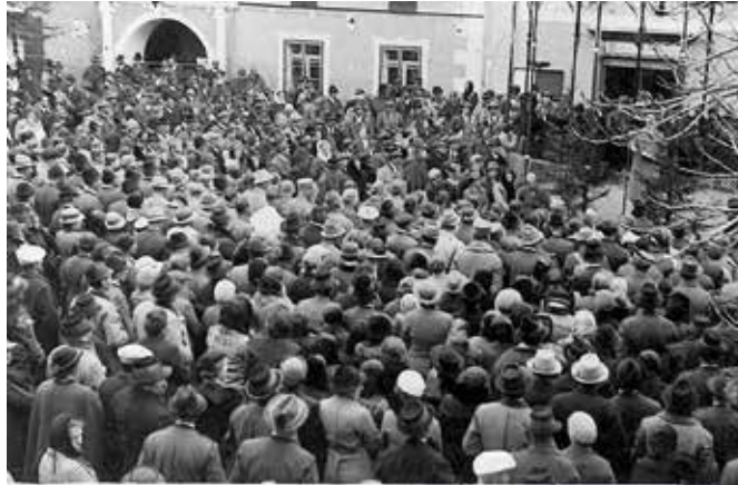
Aufmärsche und politische Kundgebungen, besonders in der NS-Zeit, spielten sich ebenfalls vorzugsweise am Schladminger Hauptplatz ab.

Manches ist aus meiner Erinnerung auch schon verschwunden und ein Lesen in historischen Beschreibungen oder das Durchblättern alter Fotos erstaunt mich immer wieder – das ist doch noch nicht so lange her – das müsste ich doch noch wissen... Ein Kind oder Jugendlicher nimmt anderes wahr als ein systematisch dokumentierender Forscher und Sammler. Es gibt durchaus noch einige Mosaiksteine, die die Erinnerung an den Schladminger Hauptplatz ergänzen können: Zum Beispiel die „ Derkogner-Patschen “. Diese Hüttenschuhe