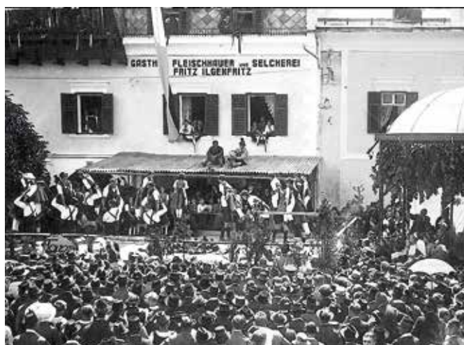
Nicht erst heutige Großveranstaltungen bringen Menschenmassen auf den Schladminger Hauptplatz. Auch Trachtenfeste, Vereinsjubiläen und andere Feierlichkeiten machten schon vor 100 und mehr Jahren den Hauptplatz zur Bühne.

man Menschenmassen, die als Akteure oder Zuschauer den Hauptplatz bevölkern. Beliebt waren große Eisschießen, für die Teile des Platzes in eine Eisbahn umgewandelt wurden und von denen die Gruppenfotos der Teilnehmenden beliebte Erinnerungstücke waren. Wie viele Faschingszüge wohl über den Hauptplatz gezogen sind? Hochzeitsgesellschaften, Trachtenfesten und Feierlichkeiten von örtlichen Vereinen bot der Schladminger Hauptplatz die entsprechende Kulisse. Auch