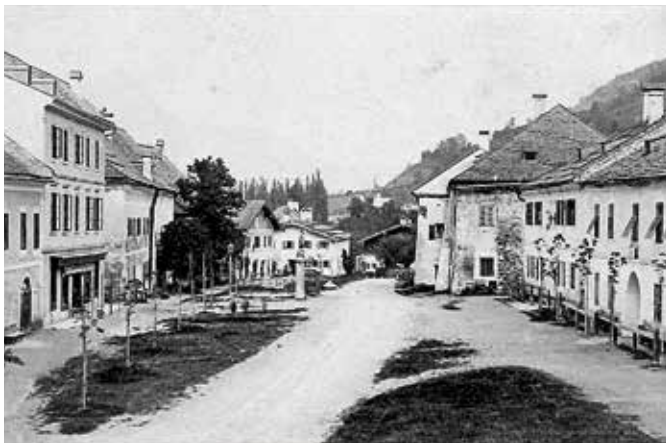
Der Schladminger Hauptplatz von Westen nach Osten. Man beachte ungefähr in der Mitte die Säule mit der Figur des hl. Florian, die im Lauf der Zeit mehrmals ihren Standort gewechselt hat. Foto aus den 1890er Jahren.

was sich in den immerhin schon weit über sechs Jahrzehnten meines bewussten Erinnerns alles verändert hat. Dazu kommt mein studien- und berufsbedingtes Interesse als Historikerin und Kulturwissenschaftlerin, dass ich auch gerne weiter zurückschaue in die Geschichte. So sollen diese Heimatkundlichen Blätter eine Mischung sein aus selbst Erlebtem und Überliefertem aus früheren Jahrhunderten.