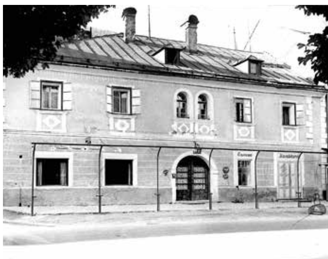
Hauptplatz Schladming, Nr. 37: Das ehemalige Café Walcher, das heute nach wie vor als Kaffeehaus- bzw. Gastronomiebetrieb in einem vergrößerten, modernisierten Neubau geführt wird.

Das in westlicher Richtung angrenzende Gebäude wirkt im modernen Ensemble des Schladminger Hauptplatzes deutlich älter, obwohl es Fotos einer schlichteren Fassadengestaltung aus dem Ende des 19. Jahrhunderts gibt. Es ist noch unter dem Hausnamen Schnitzer bekannt, gilt als das alte bürgerliche Rathaus und hat auch sonst interessante Details zur