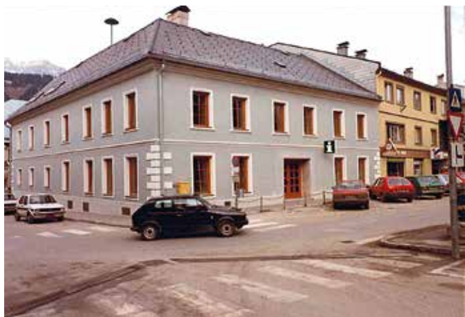
Ein „modernes“ Foto (1980) mit historischem Wert: Das Gebäude des Bezirksgerichtes, Hauptplatz 18 umgeben von Autoverkehr, der auch über die heutige Fußgängerzone am Hauptplatz führte.