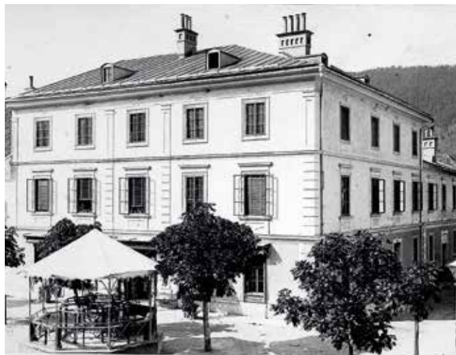
Das ehemalige Kaufhaus Herbst an der Ecke Steirergasse in einer Aufnahme aus dem Jahr 1892.

Ein Detail in einem weiteren Kaufgeschäft am Schladminger Hauptplatz hat mich als Kind magisch angezogen und ich suchte immer nach Gelegenheiten, meine Eltern dazu zu bringen, genau in diesem Kaufhaus etwas einzukaufen. Nur schemenhaft erinnere ich mich noch an die Einrichtung im Kaufhaus Herbst , Ecke Steirergasse, wo sich seit 1970 ein Bankinstitut befindet, das seither bereits wieder mehrmals modernisiert wurde. Was mir aber als Kind so wichtig war,