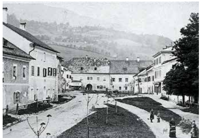
Übersichtsaufnahme von Osten nach Westen, vermutlich zeitgleich, jedenfalls noch vor Errichtung des Musikpavillons. Grün- und Verkehrsflächen sind angelegt, vor einigen Häusern noch Vorgärten.