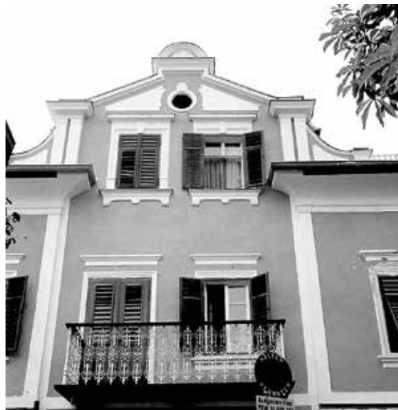
Detail der attraktiven Fassadengestaltung des Hauses Nr. 35 am Schladminger Hauptplatz. Durch mehrere Generationen war die Handwerkerfamilie Schnitzer Besitzer dieses Gebäudes. Im Bild rechts Sattlermeister Josef Schnitzer II. in seiner Werkstatt 1939.

Durch die vorwiegend moderne Architektur des Schladminger Hauptplatzes fällt es heute manchmal schwer, die Abfolge und Begrenzungen früherer Gebäude noch zu erkennen. Dies gilt auch für einen Teil der nordseitigen Häuserzeile. In meiner Erinnerung war diese noch in meiner Jugend deutlicher gegliedert. Ein Fixpunkt war der Ilgenfritz , eine der beiden inzwischen vom Hauptplatz und auch aus Schladming verschwundenen Fleischhau-