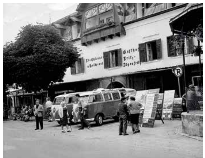
Der moderne „Fremdenverkehr“ vor historischer Fassade. Taxibusse werben für Ausflugsfahrten vor der alteingesessenen Fleischerei Ilgenfritz am Hauptplatz. Aufnahme um 1970.