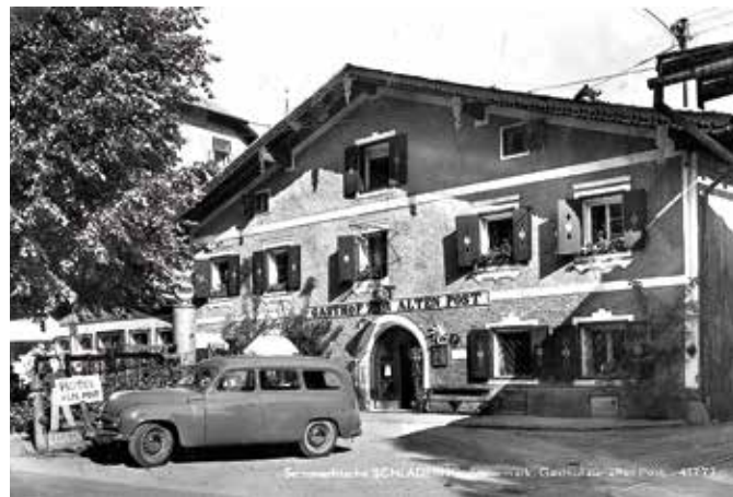
Das markante Erscheinungsbild der „Alten Post“ im regionaltypischen Baustil alpiner Flachdachhäuser war über Generationen ein Werbeträger des Hauses und wesentlicher Teil des aufstrebenden Schladminger Tourismus.