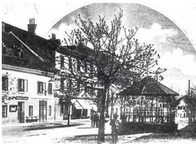
Der Pavillon am Hauptplatz – ein Anziehungspunkt für Sommerfrischler und Einheimische – war seit seiner Erbauung auch beliebtes Postkartenmotiv.

Ein zentraler Punkt am Schladminger Hauptplatz war immer der Pavillon im westlichen Drittel des Platzes, der auf Initiative des Verschönerungs-Comités – eines Vorläufers des Tourismusverbandes – und der Bürgermusikkapelle gegen Ende des 19. Jahrhunderts erbaut wurde. In seiner Hauptfunktion als Musikpavillon war er von Anfang an Mittelpunkt der sommerlichen Platzkonzerte, bei denen die Sommerfrischler ebenso beschwingt über den Platz flanierten, wie die Schladminger Bürger. Bis heute wird er für musikalische Darbietungen genutzt, ist ein markanter Orientierungspunkt am Hauptplatz und durch seine erhöhte Lage idealer Ort für die Moderation von diversen Veranstaltungen. Auch die katholische Kirche nutzte ihn z.B. als Altarraum bei der Fronleichnamsprozession oder für Segensfeiern.