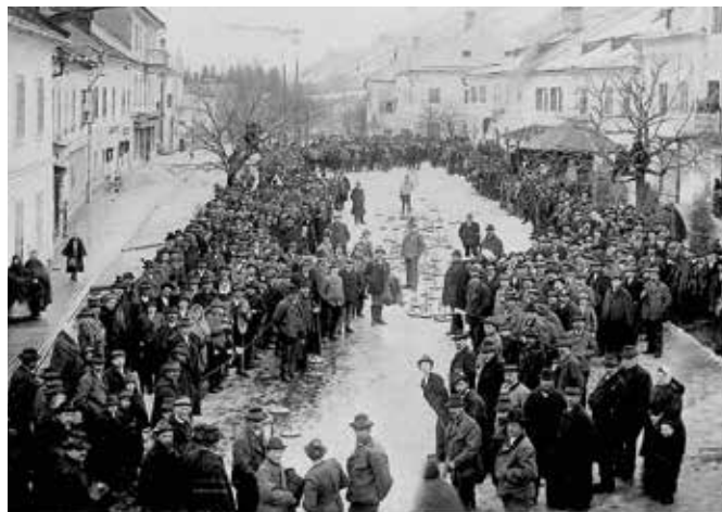
1. Steirisch-Salzburgisches Preiswett-Eisschießen in Schladming am 9. Februar 1908.