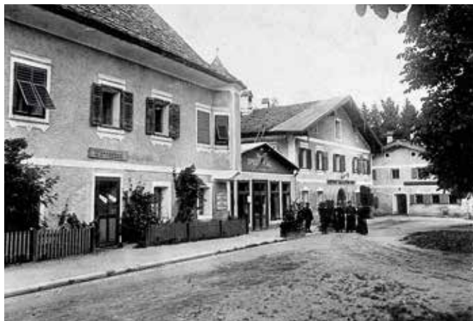
Der Gebäudekomplex der Alten Post in einer frühen Ausbauphase. Rechts das Hauptgebäude in der alten Poststation, links der noch einstöckige Trakt mit dem Wannenbad, dazwischen der Zubau mit Tanz- bzw. Speisesaal.