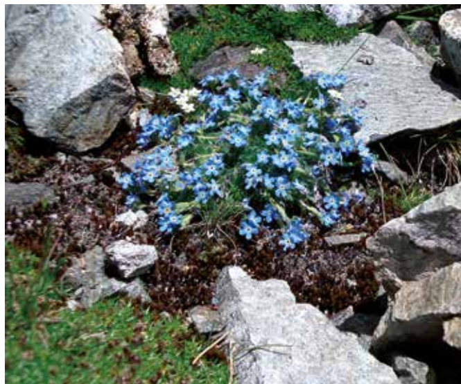
Der seltene Himmelsherold, ein weiteres Eiszeitrelikt, wird gerne mit dem Alpen-Vergissmeinnicht verwechselt.

schaft in der Silikatvegetation. Extreme Temperaturgegensätze gleicht die Edelraute – ähnlich wie das Edelweiß – durch dichte Haarbildung und Büschelwuchs aus. Stets ist sie nur an sonnigen Standorten zu finden.