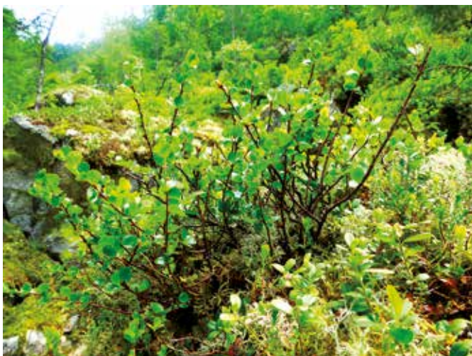
Die Zwerg-Birke wächst als sommergrüner, verzweigter Zwergstrauch und kann einen halben bis einen Meter hoch werden.

Die seltene Symbolpflanze der Schladminger Tauern ist eine Halbrossettenstaude und auch als „Silberraute“ bekannt. Sie lebt in den langsam verwitternden Spalten des Gneisfelsens (Schladminger Kristallin) und bildet zusammen mit exponierten Krustenflechten und dem Krainer Kreuzkraut eine besondere Pflanzengesell-