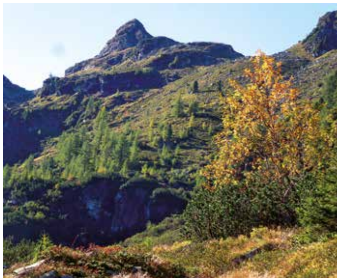
Neben der landschaftlichen Schönheit beeindruckt auch die vielfältige Pflanzen- und Tierwelt, wie hier im Patzenkar.