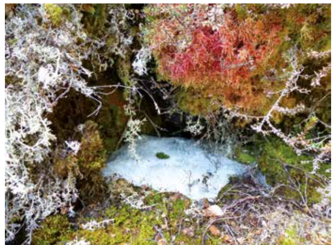
Die Besonderheit des Moores am Toteisboden ist sein raues Kleinklima, das durch den sogenannten Windröhreneffekt beeinflusst wird.