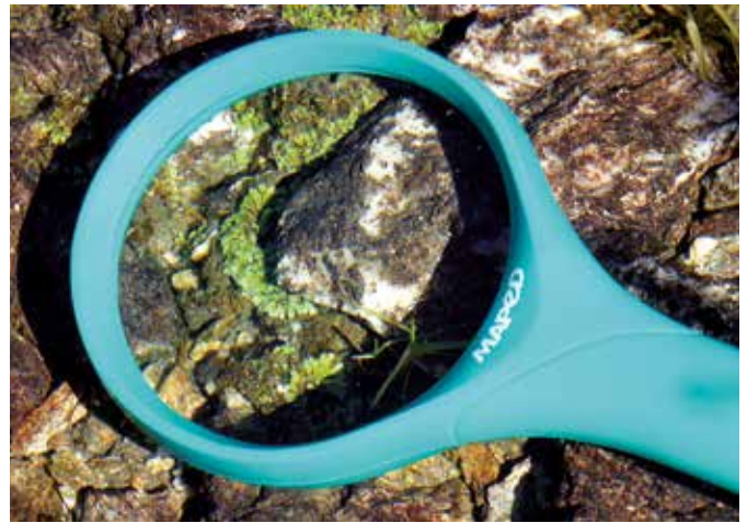
Das Breidler-Sternlebermoos kommt nur in den Alpen vor und ist streng geschützt.

Das Sternlebermoos, Riccia breidleri , ist ein Moos, das bisher nur in den Alpen gefunden worden ist. Es gilt daher als Endemit (nur in räumlich begrenzter Umgebung vorkommend) der Alpen. Als Erst-Fundort gilt das Patzenkar in den Schladminger Tauern. Wegen der großen Sporen, die nicht mit dem Wind verbreitet werden können, ist die Ausbreitungsfähigkeit sehr eingeschränkt. Als Lebensraum dienen feuchte, eher basenreiche Sandböden in vegetationsarmen alpinen Schmelzwassertümpeln mit